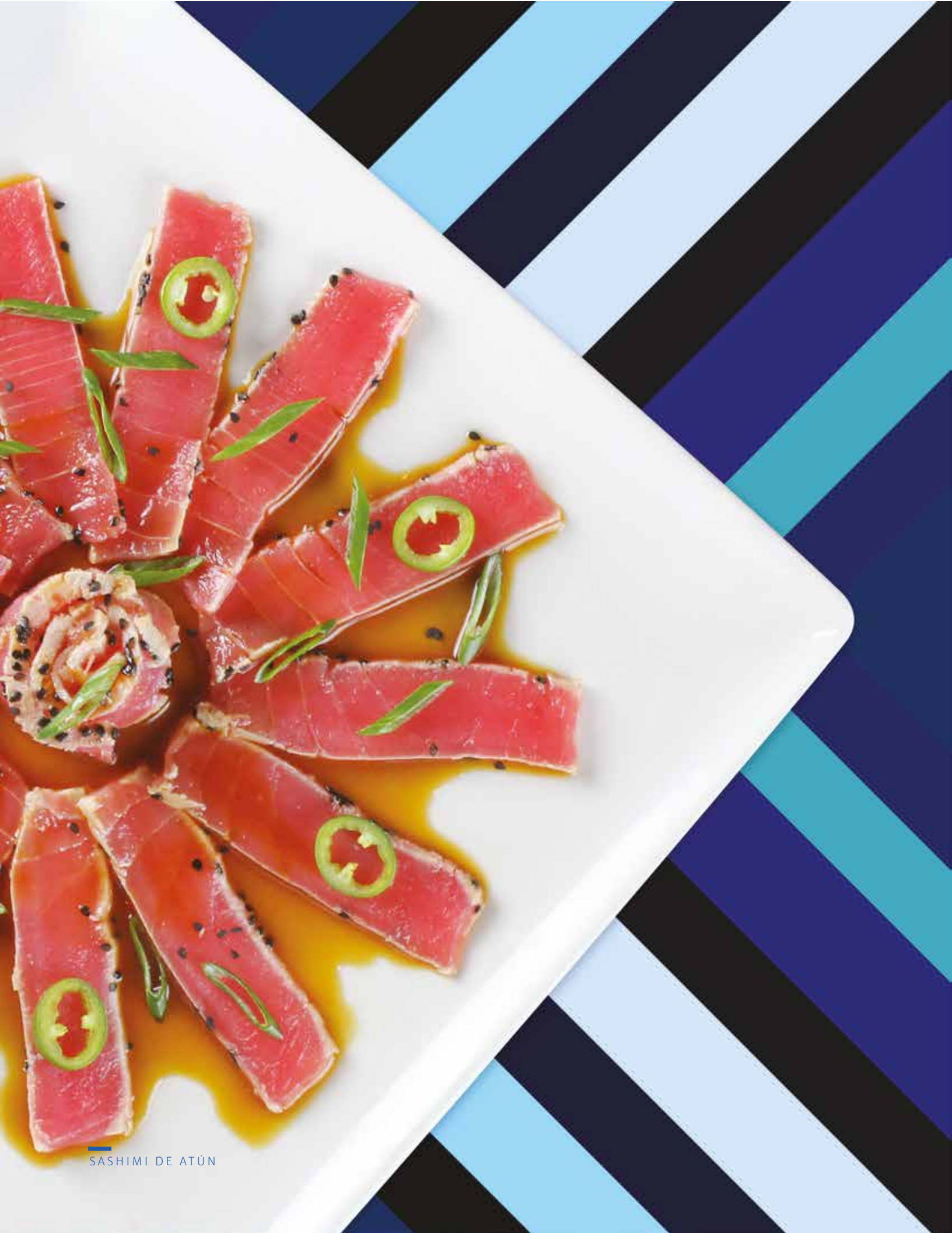
SASHIMI DE ATÚN