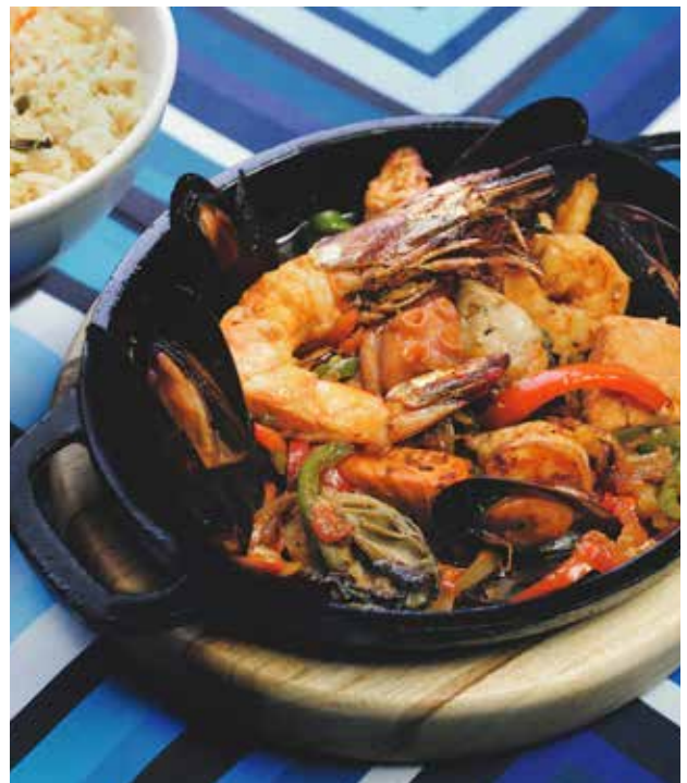
CAZUELA DE MARISCOS. Camarón, salmón, pulpo, ostiones y mejillones con el adobo de la casa, al horno Jospser. 320 grs. $340