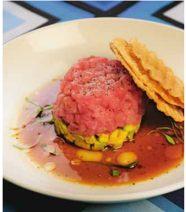
TARTAR DE ATÚN. ¡Con el toque de la casa! 100 grs. $165