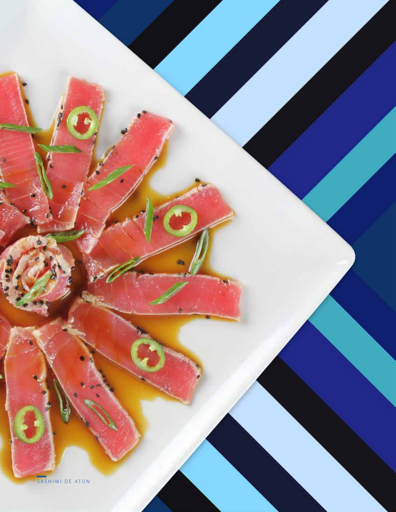
SASHIMI DE ATÚN