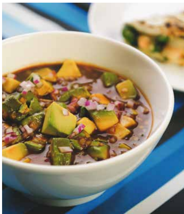
SALSA DE AGUACATE. Trozos de aguacate, ligeramente picante en salsas negras. 150 grs. $92