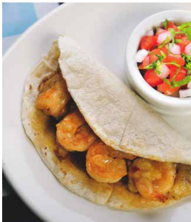
TACO MEXICALI. Combinación de camarón y queso con mezcla de chiles. 70 grs. $70

TE PRESENTAMOS NUESTRAS NUEVAS CREACIONES. ¡PÍDELAS AHORA!