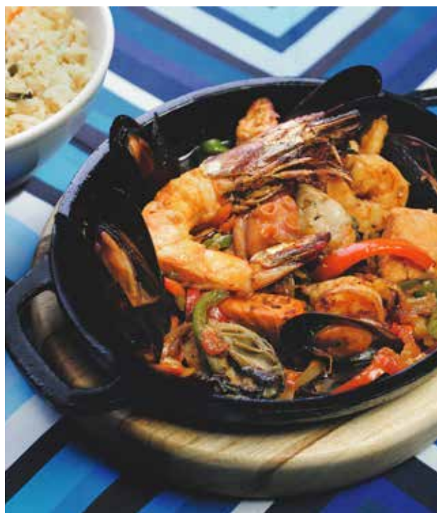
CAZUELA DE MARISCOS. Camarón, salmón, pulpo, ostiones y mejillones con el adobo de la casa, al horno Josper. 320 grs. $374