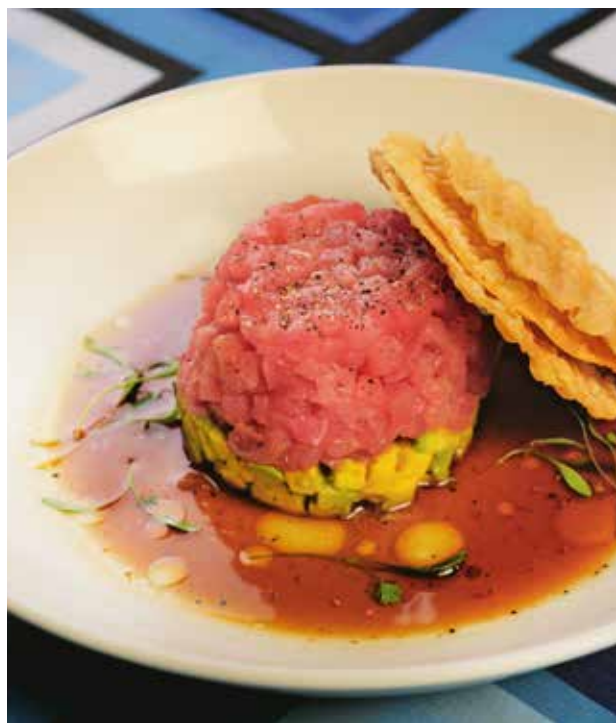
TARTAR DE ATÚN. ¡Con el toque de la casa! 100 grs. $182